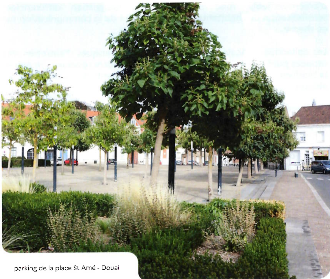
parking de la place St Amé - Douai

Elle décrit les actions dans lesquelles s'engage la collectivité pour favoriser la mise en œuvre d'un entretien des espaces publics respectueux de notre ressource en eau et de la biodiversité.